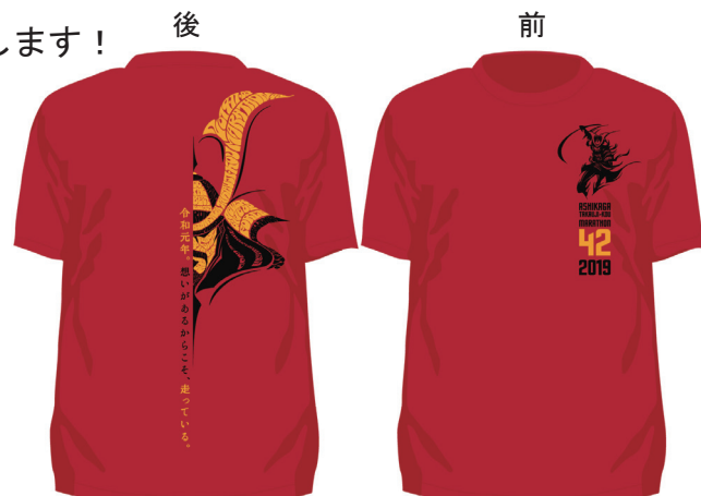
画面はイメージです。(見本の色はガーネットレッドです。)